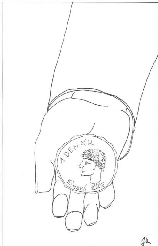
29. neděle v mezidobí cyklu A Mt 22,15-21