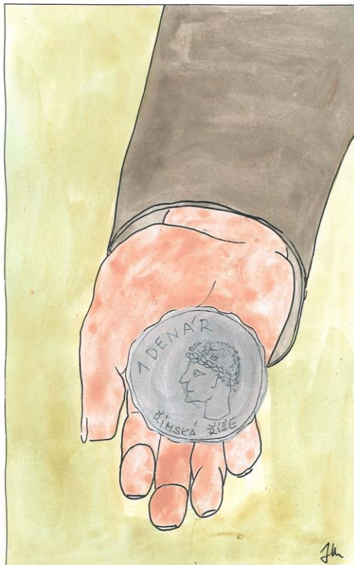
29. neděle v mezidobí cyklu A Mt 22,15-21