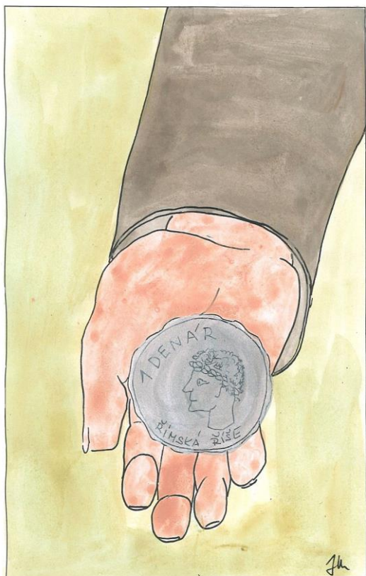
29. neděle v mezidobí cyklu A Mt 22,15-21