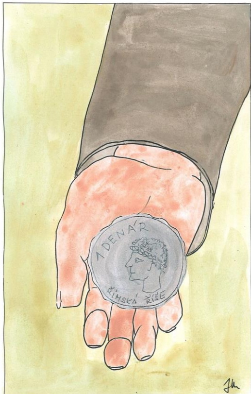
29. neděle v mezidobí cyklu A Mt 22,15-21