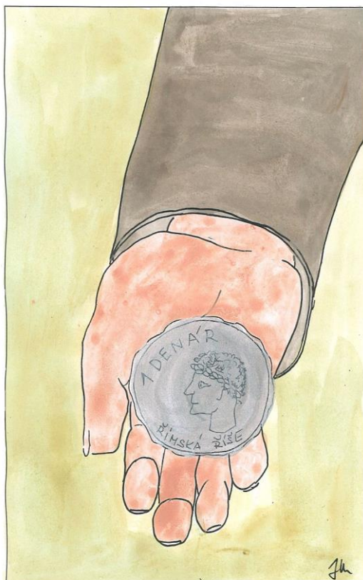
29. neděle v mezidobí cyklu A Mt 22,15-21