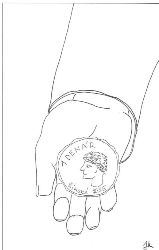
29. neděle v mezidobí cyklu A Mt 22,15-21